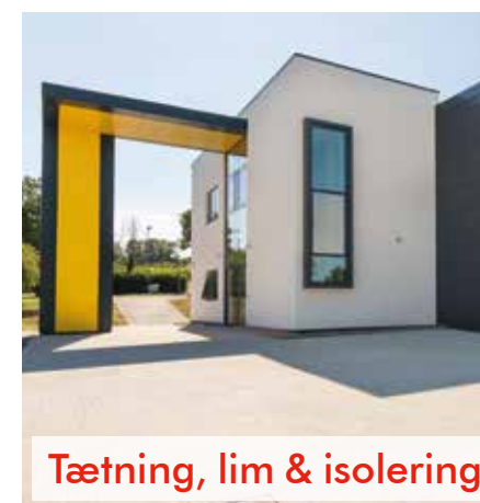
Tætning, lim & isolering

Varemærkerne under Tremco CPG Europe dækker mange forskellige behov i byggebranchen og tilbyder en unik kombination af avancerede services, support og systemer, – noget man sjældent finder samlet hos én og samme leverandør.